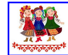
DANSE FOLKLORE DU MONDE